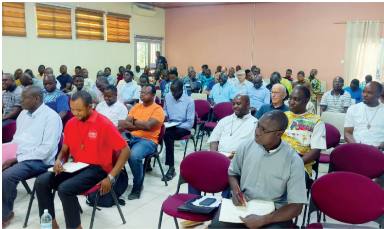
Des prêtres attentifs à l'enseignement

Ils étaient une centaine de Prêtres ayant participé à la Formation Permanente qui a eu lieu du Lundi 23 au Jeudi 26 Mars 2026 à la Procure Diocésaine de MAROUA-MOKOLO ; Formation qui s'est clôturée avec la Célébration de la Messe Chrismale le Jeudi 26 Mars 2026 à la Cathédrale Notre-Dame de l'Assomption de FOUNANGUÉ-MAROUA.