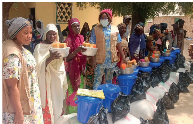
Se décider, se lever et se mettre au service des vulnérables

engagement audacieux pour la Justice et la Réconciliation dans la communauté. Il faut dire que la Foi Pascale peut inspirer des initiatives concrètes dans nos communautés de plusieurs manières. Partant de la Résurrection de Jésus qui est un symbole fort de renouveau et de transformation, cela peut inspirer les chrétiens en s'engageant dans des projets de développement local, de protection de l'environnement et de promotion de la justice sociale, à créer des