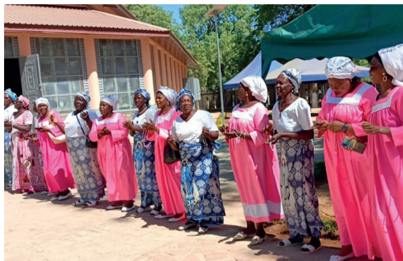
Elles ravivent la foi dans nos communautés chrétiennes

tombeau, et nous ne savons pas où on l'a déposé. [...] Marie Madeleine se tenait près du tombeau, au-dehors, tout en pleurs. » (Jn 20, 2 ; 11). L'Espérance, ici, est cette capacité de voir la lumière malgré l'obscurité. Nous les voyons bien présentes et bien nombreuses dans nos églises, dans les situations de deuil, de maladie, de souffrance humaine, etc.