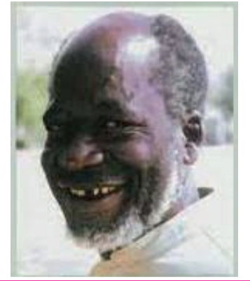
Prière de demande de béatification Vénérable Simon MPEKE P. 10