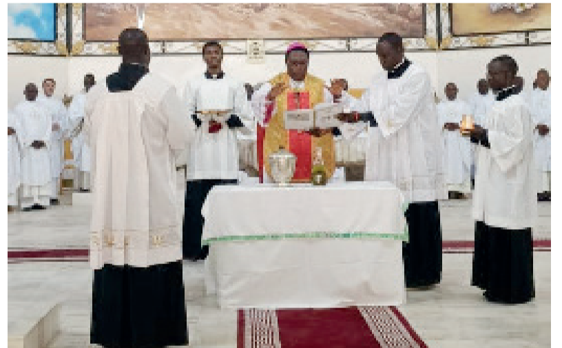
Bénédition des huiles