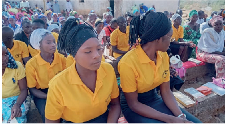
Le Christ ressuscité est notre Espérance

La Résurrection du Seigneur vient relancer la vie des Jeunes qui semblent souvent être désespérés et dépassés par certains événements de la vie qui les font mourir parfois en eux.