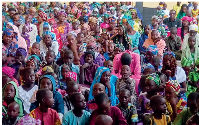
Une foule que nul ne peut compter

Vivre la Journée du Désert avec le Christ en l'accompagnant au Calvaire et s'édifier en entrant dans l'intelligence des Sacrements ont meublé la journée du Vendredi Saint pour les Fidèles de la Paroisse Saint Paul de MORA.