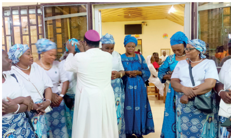
Bénédition épiscopale et chèque d'amour aux paroissiens

Communication Diocésaine de MAROUA-MOKOLO