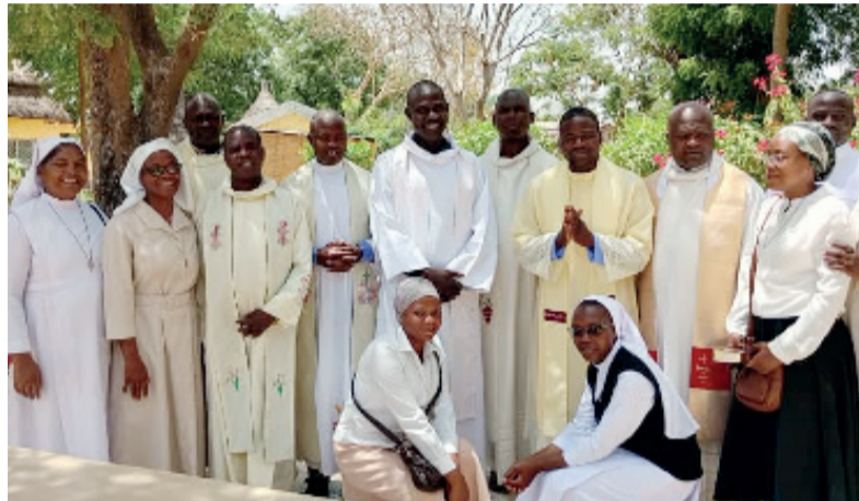
Photo de famille après la messe