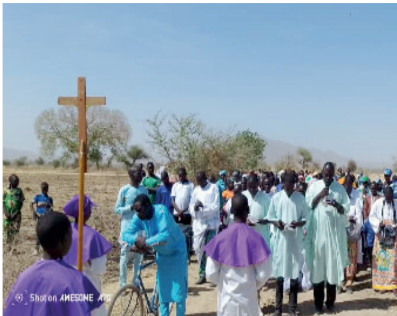
Vivre le chemin de la passion avec Jésus

Des centaines de fidèles ont participé au Pèlerinage organisé dans la Paroisse Notre-Dame de la Présentation de HINA afin de raviver leur foi et de se préparer aux fêtes pascales.