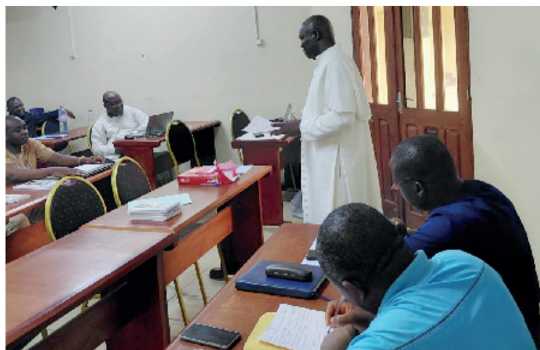
Être bien formé pour mieux accompagner