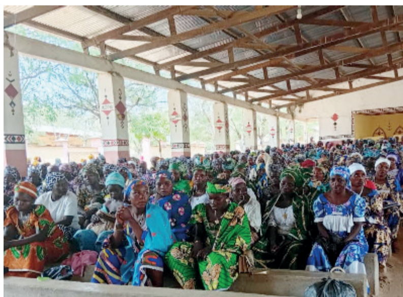
Des femmes attentives à l'enseignement

Le 14 Mars 2026, toutes les femmes des Paroisses de la Zone Pastorale de MOKOLO se sont retrouvées dans la Paroisse Sainte Famille de MOKOLO-TADA pour une Récollecion autour du Thème Diocésain, « Le Partage », afin de se préparer spirituellement à vivre les Fêtes Pascales.