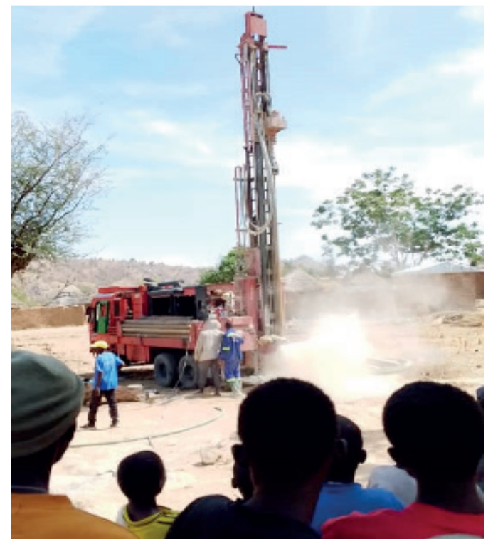
L'eau, c'est la vie

Donnez de vos nouvelles, lisez et faites lire Vie de l'Eglise