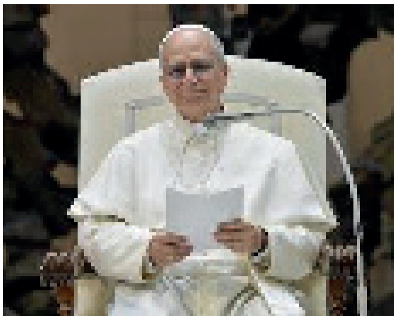
Pape Léon XIV

Le Christ, notre « Roi victorieux », a mené et remporté son combat dans un abandon confiant en la volonté du Père, en son