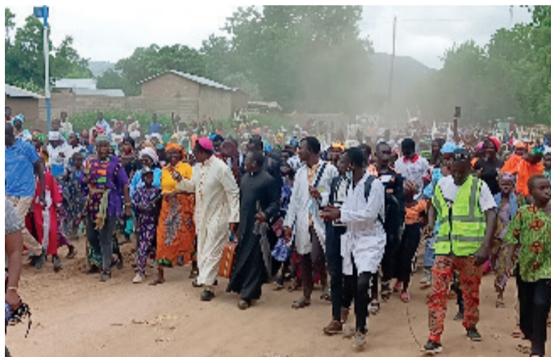
L'Eglise du Christ en marche vers le Royaume

Concrètement donc, les signes de la Résurrection dans la Vie Communautaire/ Ecclésiale sont entre autres : Premièrement , la Charité Fraternelle : « Voyez comme ils s'aiment. » La Charité vécue - Partage, Solidarité, Pardon - constitue un Signe Tangible de la Vie Nouvelle. La Première Lettre de Saint Jean le souligne avec force : « Nous savons que nous sommes passés de la mort à la vie, parce que nous aimons nos frères » (1 Jn 3, 14). Ensuite , la Liturgie, cœur