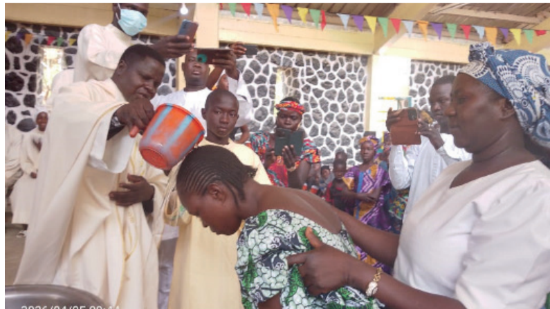
Être baptisé dans le Christ, mort et ressuscité

« Si quelqu'un veut venir à ma suite, qu'il prenne sa croix chaque jour et qu'il me suive » (Luc 9, 23).