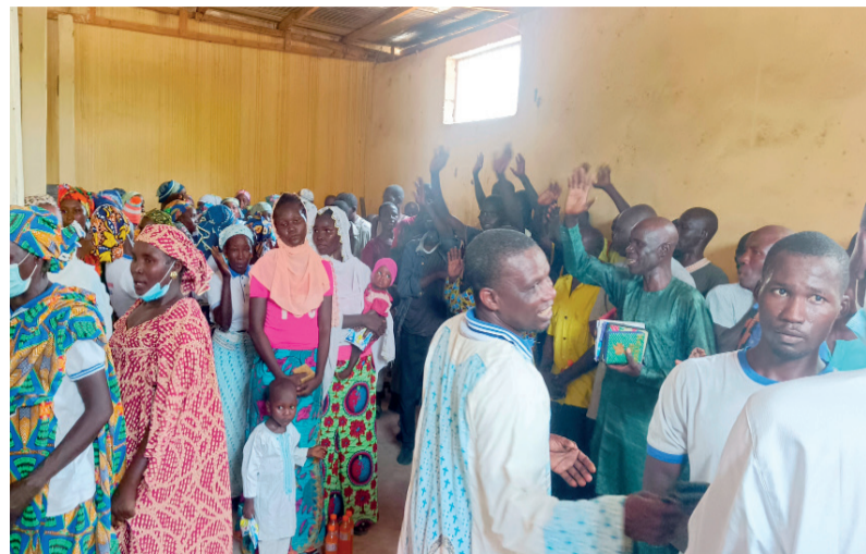
Quand la séparation devient difficile

Dans la ferveur des préparatifs marquant son Jubilé Diocésain qui aura lieu dans la Paroisse Saint Paul de MORA, le Groupe de la Miséricorde Divine de la Zone Pastorale MAYO-SAVA et les Fidèles de ladite Paroisse ont effectué ce 16 Mars 2026 une descente à la Prison de MORA. Cette démarche, placée sous le signe de la Compassion et de l'Espérance, visait à porter un Message de Réconfort aux Prisonniers.